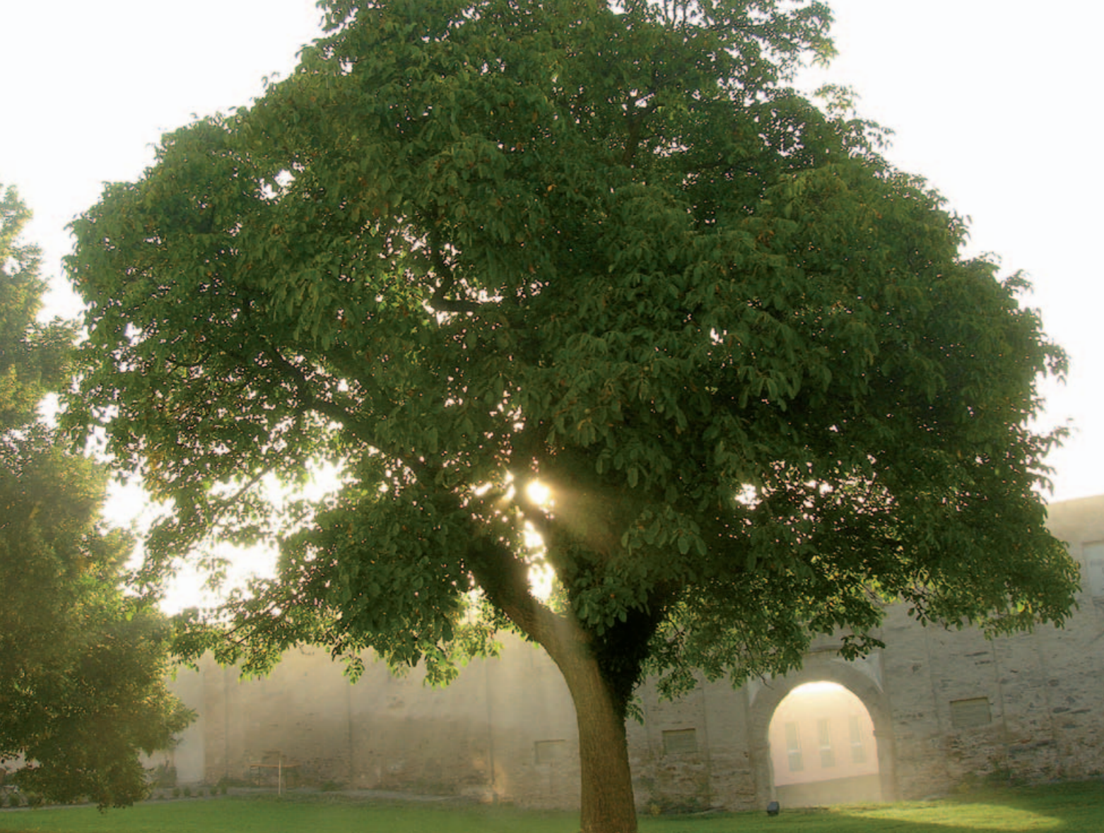
Kloster Pernegg – Innenhof