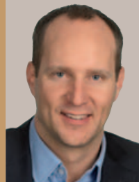
Dr. Matthias Strolz